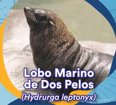
Lobo Marino de Dos Pelos ( Hydrurga leptonyx )

Especie propia de la Antártida la cual se encontraba totalmente fuera de su área de distribución. Después de algunos exámenes y administración de tratamientos, fue reinsertada al mar.