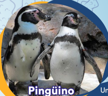
Pingüino ( Spheniscus demersus )

En hipotermia ingresó también al CRFM. Actualmente se encuentra en tratamiento y se observó que, más allá de su patología de ingreso, presenta una gran cantidad de basura en el estómago, la cual se está haciendo liberar de a poco. El proceso de rehabilitación total de esta tortuga, se prevé como muy largo.