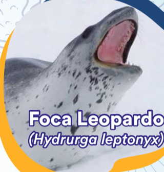
Foca Leopardo ( Hydrurga leptonyx )

En los últimos meses, se acudió en ayuda de varias especies, entre ellos: