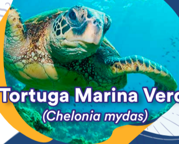
Tortuga Marina Verde ( Chelonia mydas )

Fueron atendidos dos lobos marinos de dos pelos, uno de los cuales fue rehabilitado y reinsertado al mar mientras que el otro, en muy mal estado, continúa en tratamiento con pronóstico reservado.